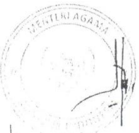
LUKMAN HAKIM SAIFUDDIN

MENTERI PENDAYAGUNAAN APARATUR NEGARA DAN REFORMASI BIROKRASI REPUBLIK INDONESIA,